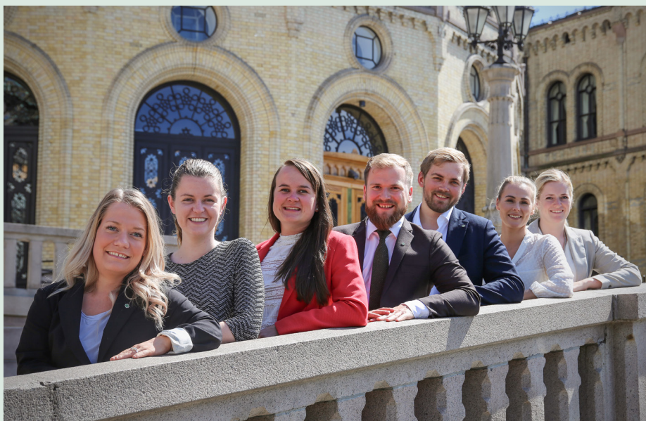
Sjøl på Stortinget er det Senterungdomslag.

«Senterungdommen har til oppgave å samle ungdom som vil arbeide for å utvikle de senterpolitiske ideene. Gjennom politisk og kulturell opplysningsvirksomhet, aktiv deltagelse i samfunnsdebatt og god og allsidig lagsvirksomhet, vil Senterungdommen være med å skape økt interesse for samfunnsspørsmål blant ungdommen og dyktiggjøre den for de oppgaver som et demokratisk styre pålegger den enkelte.»