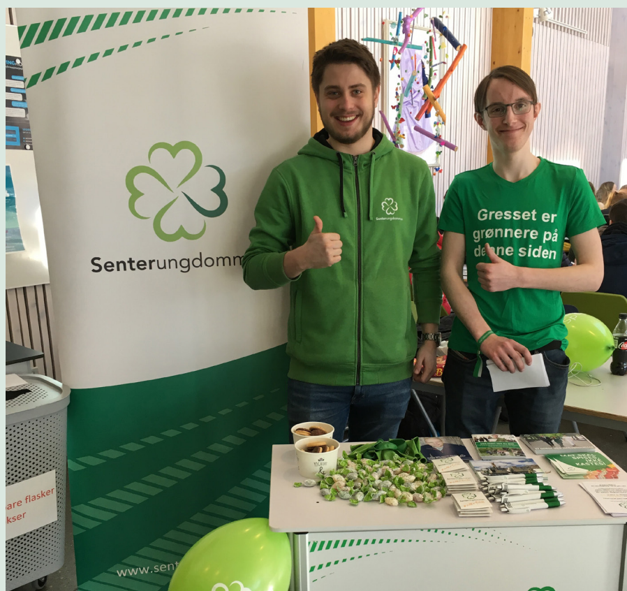
Senterungdommer på stand på Orkdal VGS.

Husk at standen ikke bare skal informere om laget, men at den også er en nødvendig kilde til å få impulser tilbake. LYTT! En populær aktivitet å ha på stand er «klagemur» eller en krukke der forbipasserende kan skrive ned saker de er opptatt av.