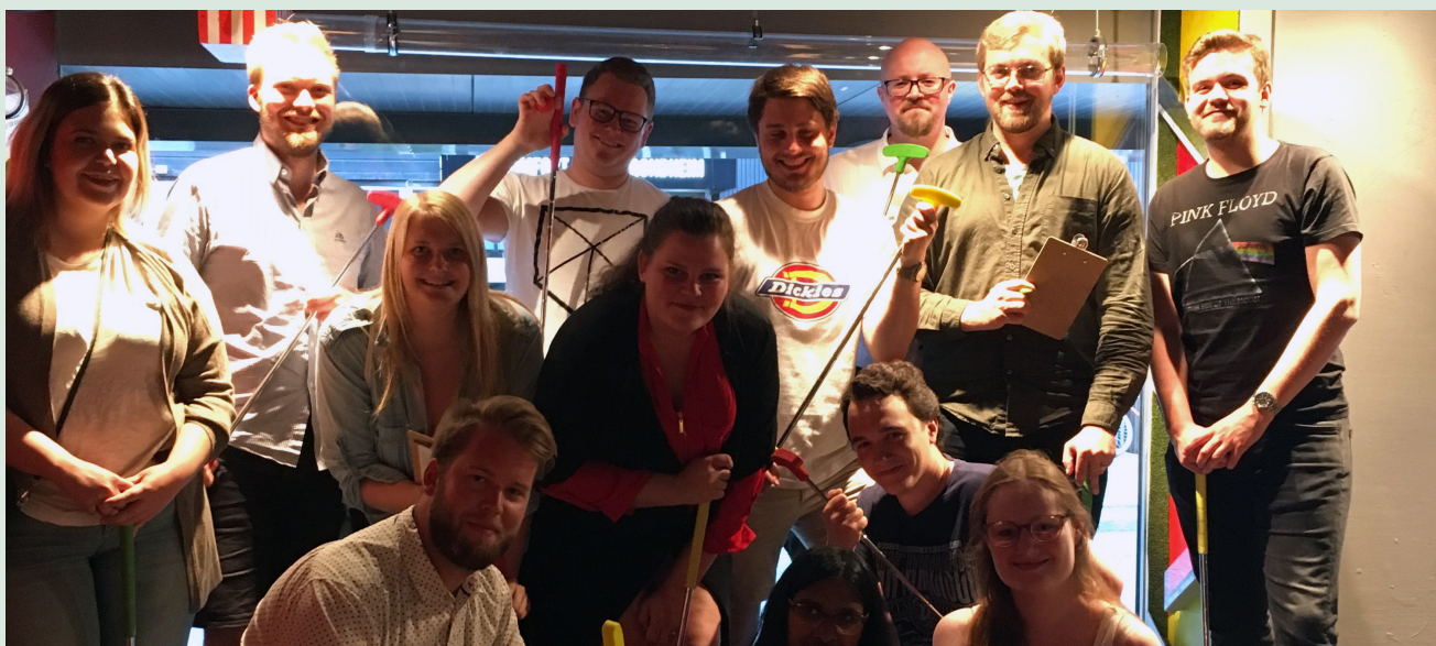
Trondheim Senterstud på minigolf.